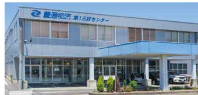
豊通物流株式会社 第1三好センター